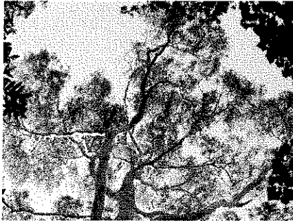
The comparison of 3D histology images of the breast with plants and flowers is striking