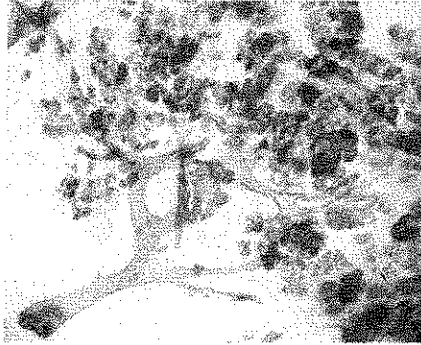
3D image of the breast tissue