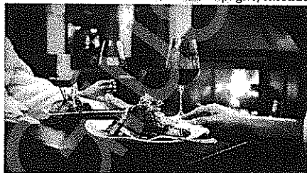
I consumi alimentari per fine anno sono in crescita

A Capodanno gli italiani hanno speso a tavola 1,7 miliardi di euro, con un aumento del 6% rispetto allo scorso anno. E quanto emerge da un'analisi di Coldiretti, secondo cui quasi due italiani su tre (il 64%) hanno trascorso la ricorrenza a casa. «Si inverte», afferma lo studio, «la tendenza al ribasso e sale la spesa a tavola degli italiani. La difficile situazione economica ha indubbiamente pesato sulle scelte degli italiani, spingendo la maggioranza dei cittadini a preferire soluzioni casalinghe, pur senza rinunciare ai piaceri della tavola, anche in un momento di difficoltà economica».